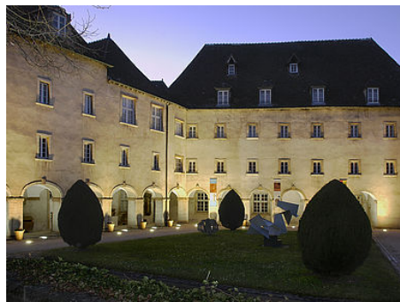
Votre événement au musée des Ursulines