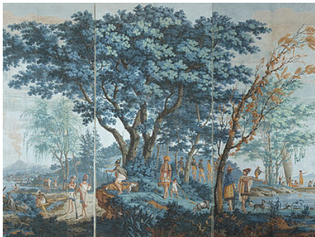
Musée et collections

Info COVID-19 : Le PASS SANITAIRE est désormais obligatoire pour accéder au musée. Le respect des gestes barrière et le port du masque dès 6 ans sont obligatoires pour les activités culturelles.