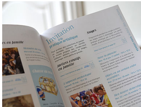
Saison / Programmation