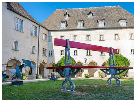
L'édifice, un témoignage remarquable

https://docs.google.com/forms/d/e/1FAIpQLSdmUaSiY3h5Y-NAUFMeHiUv_AMNLqOHZA-vfIaL7NQheMCQg/viewform?usp=sf_link