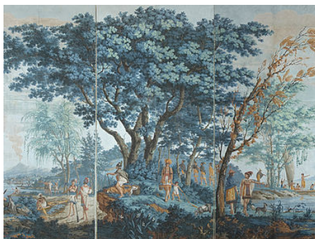
Des collections diversifiées