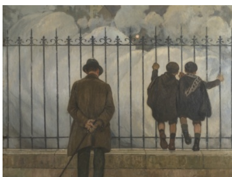
La vie des collections