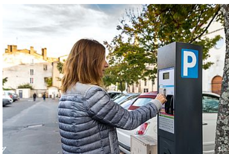
Les tarifs du stationnement