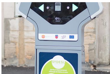
Les emplacements avec borne de recharge