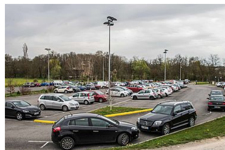
Le stationnement à la gare TGV Mâcon-Loché