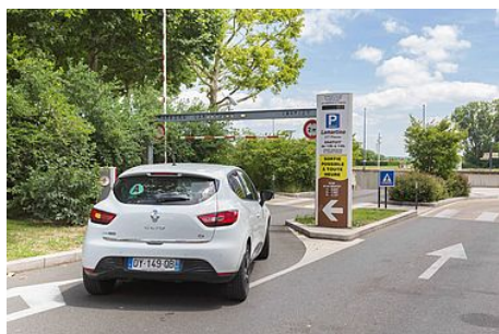
Les parkings de stationnement