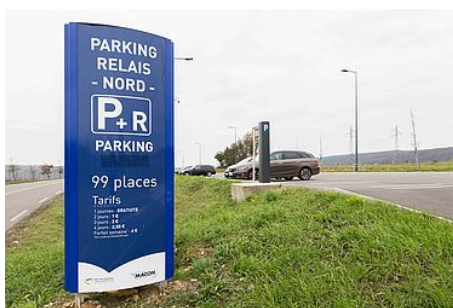
Les aires de covoiturage