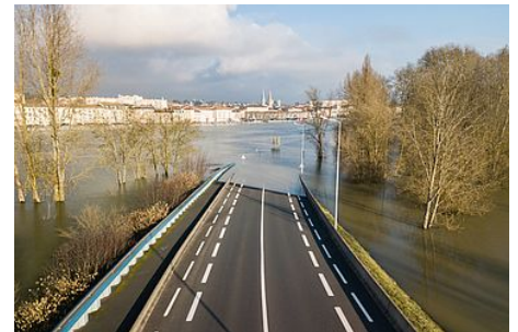
Les crues de la petite Grosne