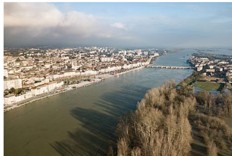
Les crues de la Saône