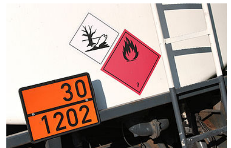
Les risques des transports de matières dangereuses