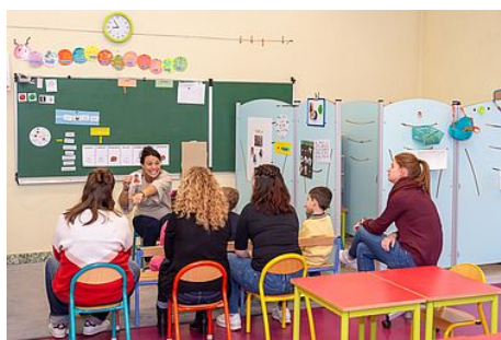
Accueil spécialisé pour les enfants à besoins particuliers

Pour une prise en compte au plus près des besoins, un groupe de travail « handicap, égalité, citoyenneté » a été créé en novembre 2008. Il regroupe une dizaine d'associations.