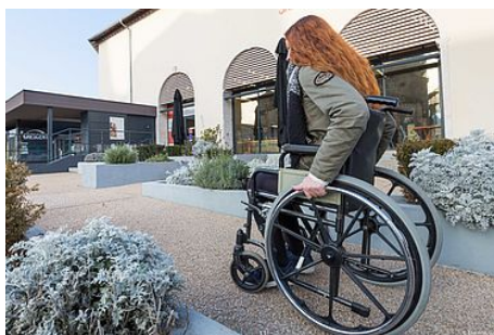
La maison départementale de l'autonomie