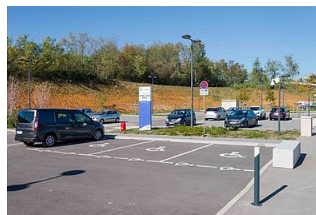
Le stationnement pour personnes à mobilité réduite