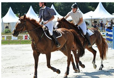
L'insertion des personnes handicapées par le sport