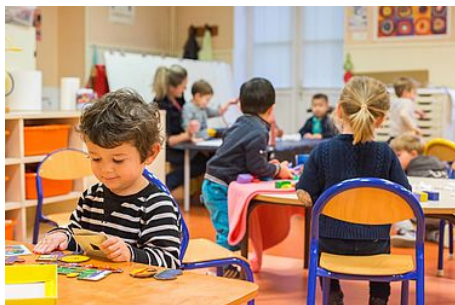
Les inscriptions scolaires et périscolaires