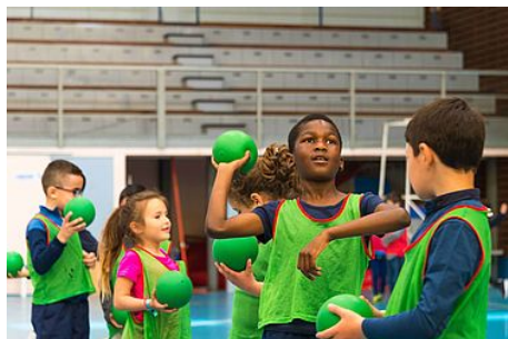
Les inscriptions aux activités de loisirs