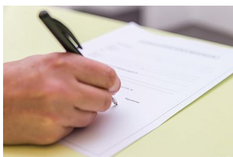
Légalisation de signature