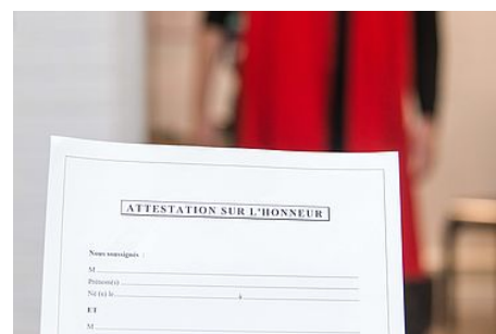
Certificat de concubinage