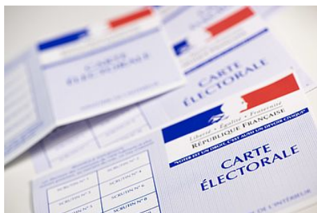
Inscription sur les listes électorales