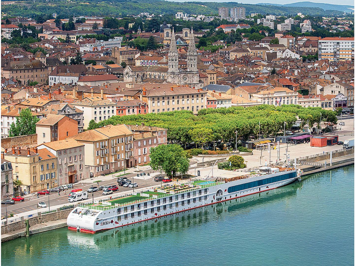
Bateau de croisière quai des Marans