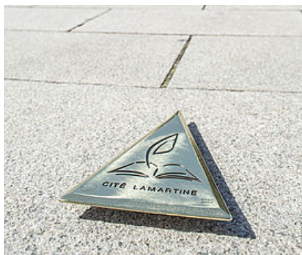
Le tracé de la plume

N'oublions pas l'église Saint-Pierre, de style néo-roman ou l'apothicairerie style Louis XV de l'hôtel-Dieu, impeccablement conservée.