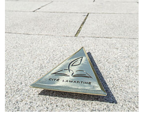
Le tracé de la plume