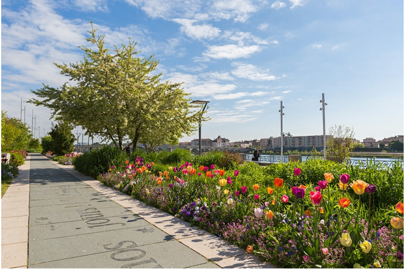
Le fleurissement à Mâcon