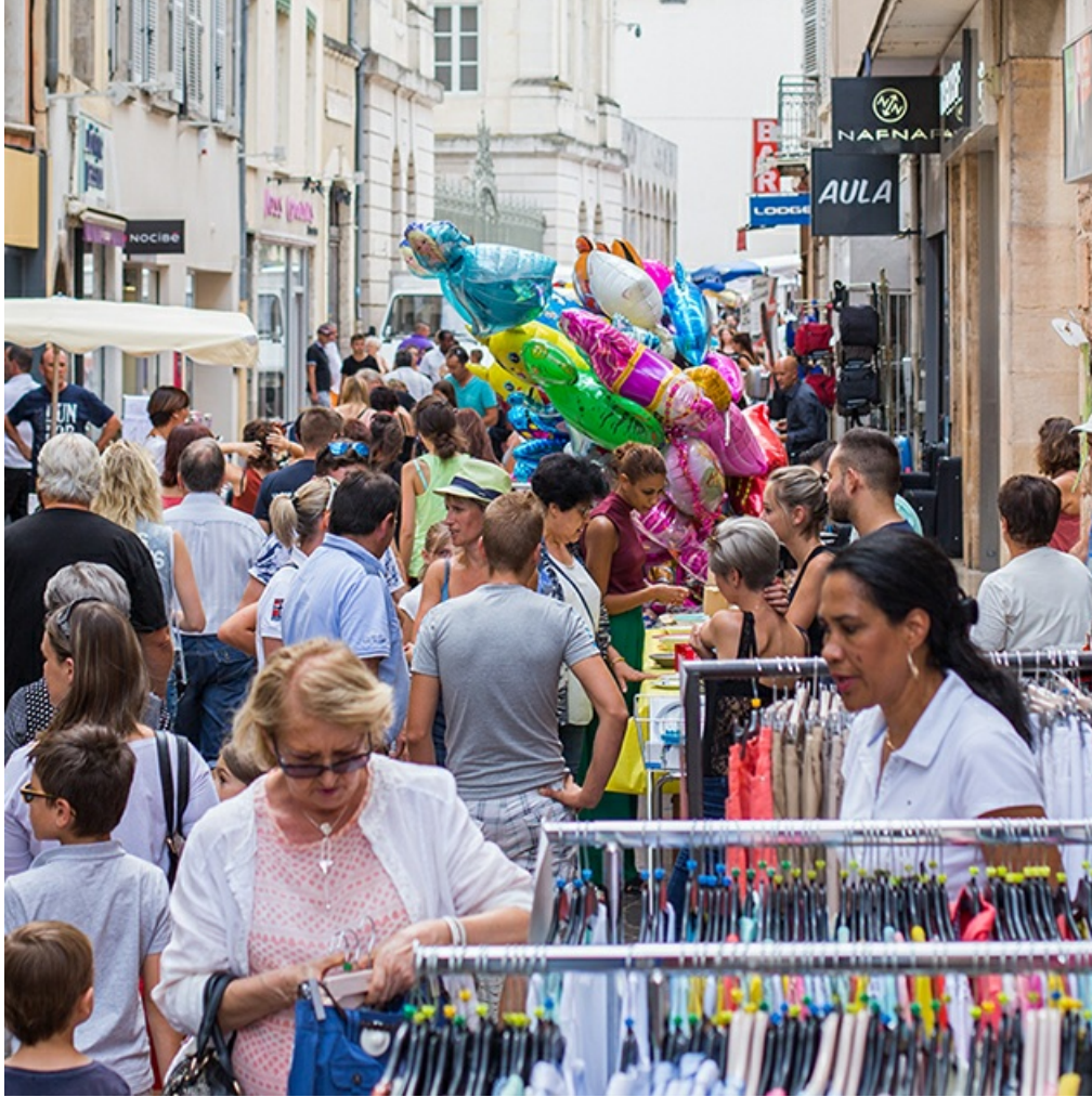
Le grand déballage en centre-ville