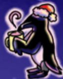
Marchés de Noël