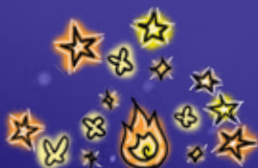
Spectacles et installations