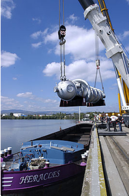
La plateforme multimodale Aproport