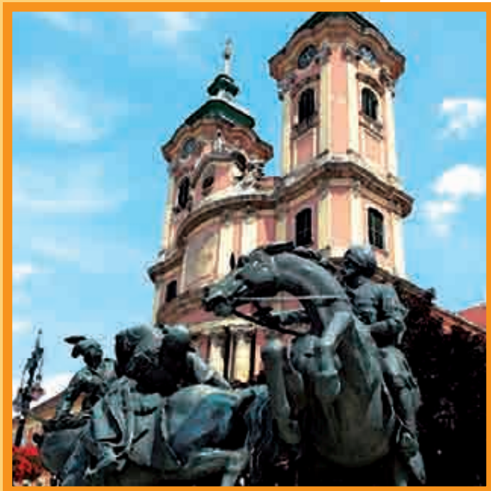
UNE DES PLUS BELLES ÉGLISE BAROQUE D'EUROPE CENTRALE : L'ÉGLISE DES MINORITES