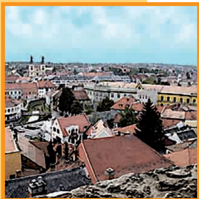
VUE SUR LA VIEILLE-VILLE DEPUIS LES REMPARTS DU CHÂTEAU