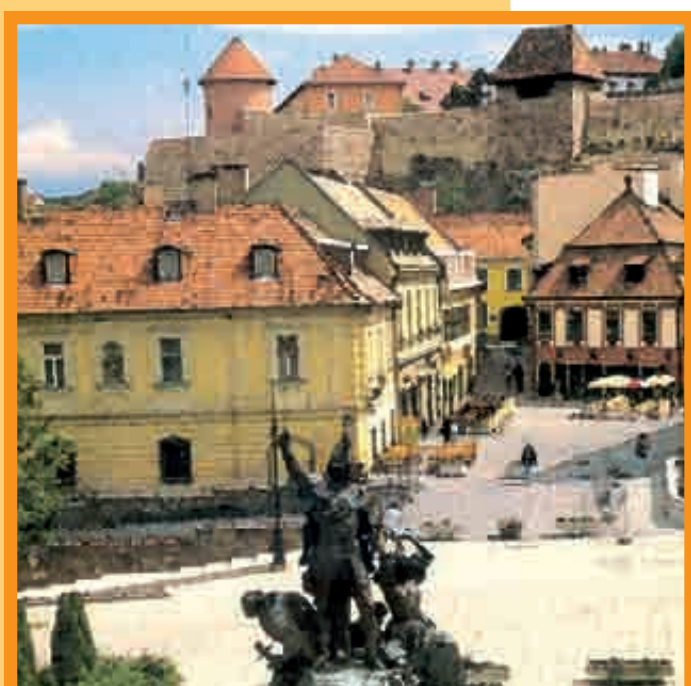
CES STATUES DE LA PLACE DOBO (PRINCIPALE PLACE DE LA VILLE), COMMÉMORANT LA VICTOIRE DE 1552 SUR LES TURQUES.

Entourée des montagnes "Büll" à l'Ouest et "Matra" à l'Est, la ville d'Eger est installée dans la vallée de la rivière du même nom.