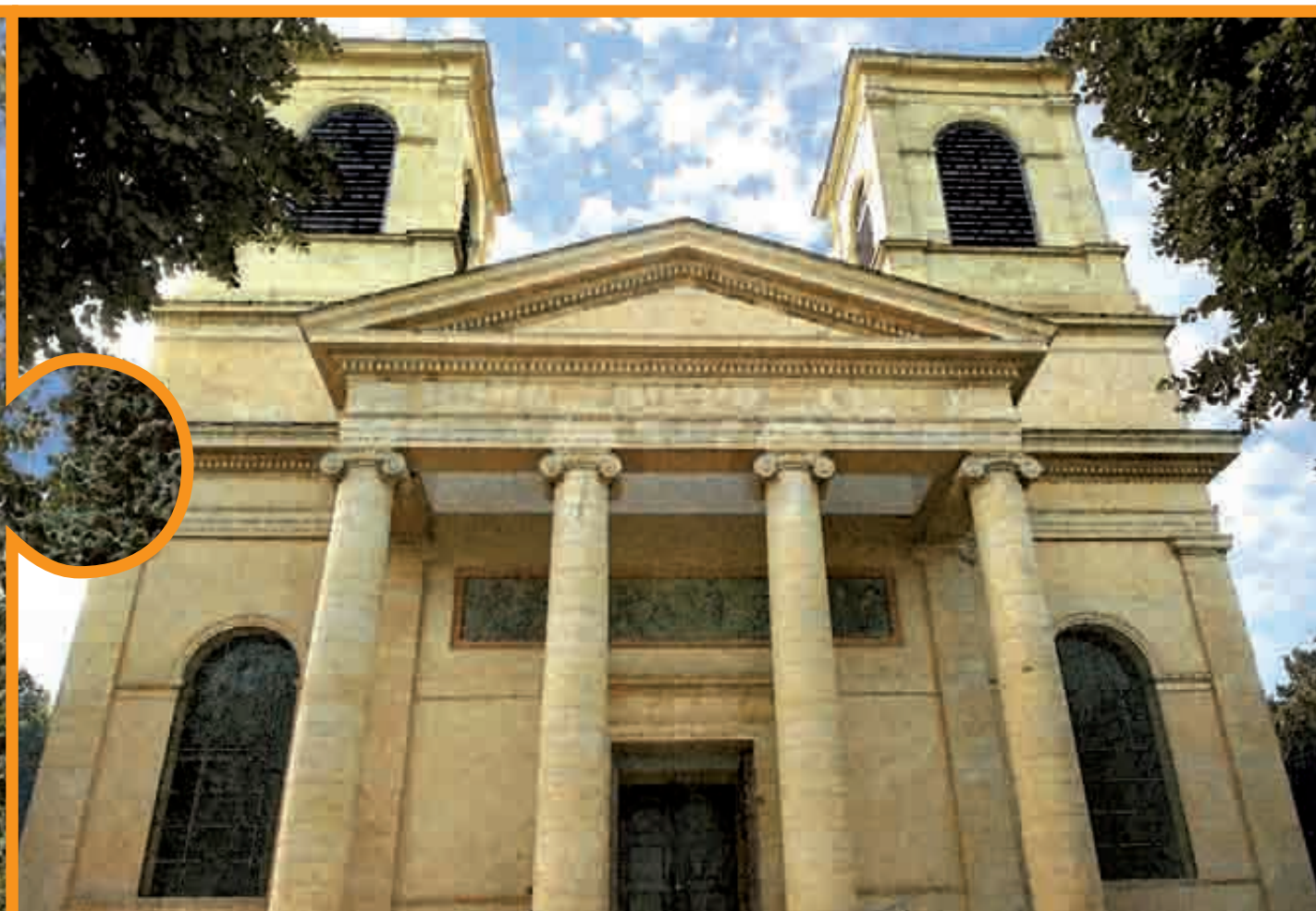
LA BASILIQUE D'EGER, DE STYLE CLASSIQUE, EST LA 2ÈME PLUS GRANDE ÉGLISE DE HONGRIE. LES AMOUREUX DE MUSIQUE BAROQUE PEUVENT Y ÉCOUTER DES CONCERTS D'ORGUE COMME DANS LA CATHÉDRALE SAINT-VINCENT DE MÂCON.