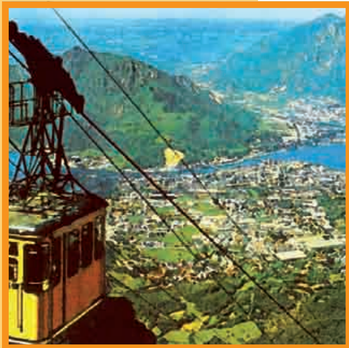
SITUÉE À 215 M D'ALTITUDE DANS LES PRÉALPES LOMBARDES