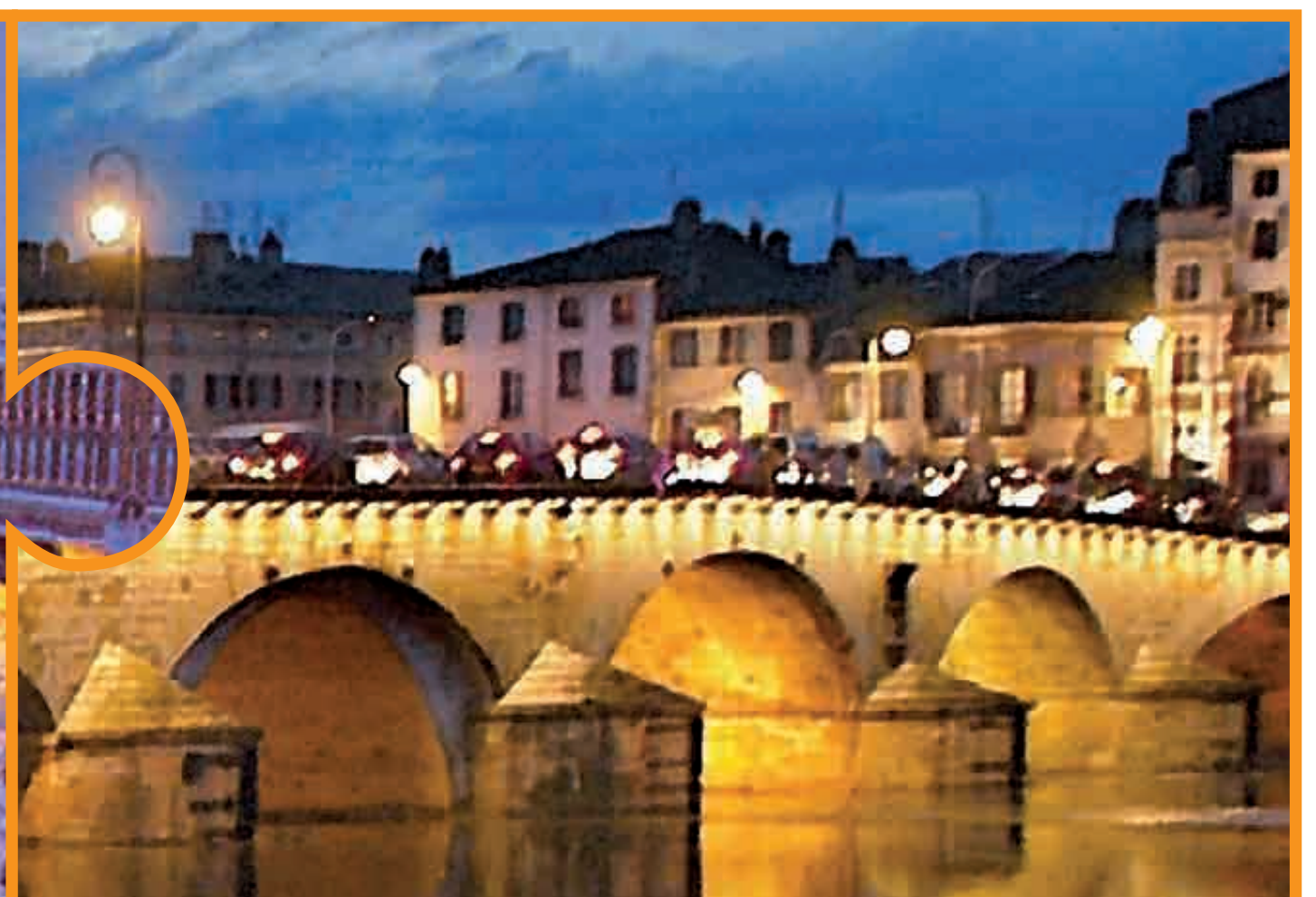
... C'EST À CETTE ÉPOQUE QUE LE PONT SAINT-LAURENT EST RECONSTRUIT ET RALLONGÉ APRÈS LA CRUE DESTRUCTRICE DE 1423.