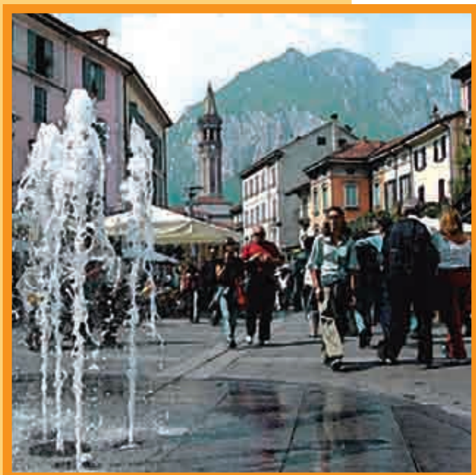
VENEZ GOÛTER LA DOUCEUR DE VIVRE DE LA STATION BALNÉAIRE

L onquise en 1335 par le seigneur Azzone Visconti, Lecco est alors intégrée au Duché de Milan.