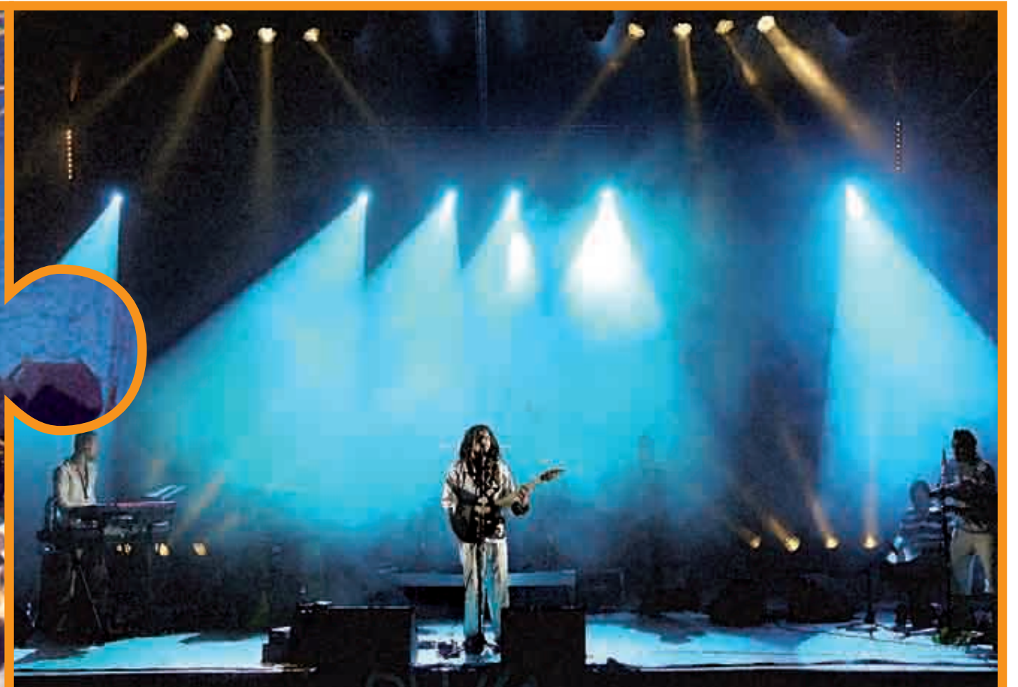
... UN PEU COMME L'ÉTÉ FRAPPÉ + À MÂCON.