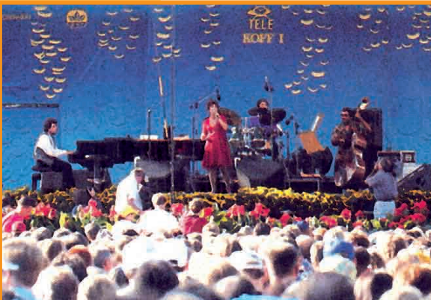
LE FESTIVAL INTERNATIONAL DE JAZZ DE PORI EST L'ÉVÈNEMENT MUSICAL DE L'ANNÉE...

Alors qu'elle se prépare à fêter son 450ème anniversaire, Pori est une ville dynamique et active qui est fière de sa longue histoire !