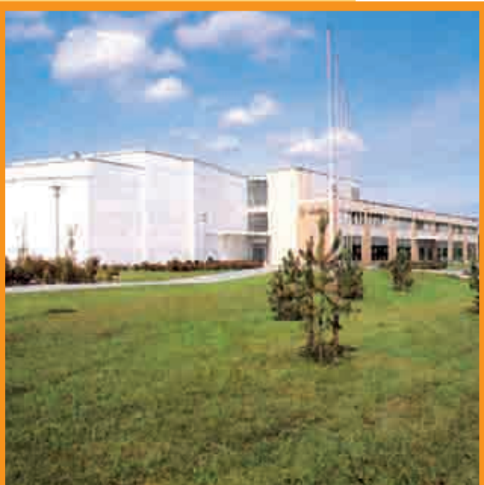
LE CENTRE DE TECHNOLOGIE DE PRIPOLI, RECONNU POUR SON EXCELLENCE.

L' histoire de Pori remonte à 1558, année où le Duc de Finlande Juhana (fils du roi Gustave de Suède) décida de créer une importante ville de commerce sur le littoral du golfe de Botnie. Depuis l'indépendance de la Finlande en 1917, Pori s'est développée jusqu'à devenir une ville industrielle et portuaire de premier plan ainsi qu'un important pôle universitaire.