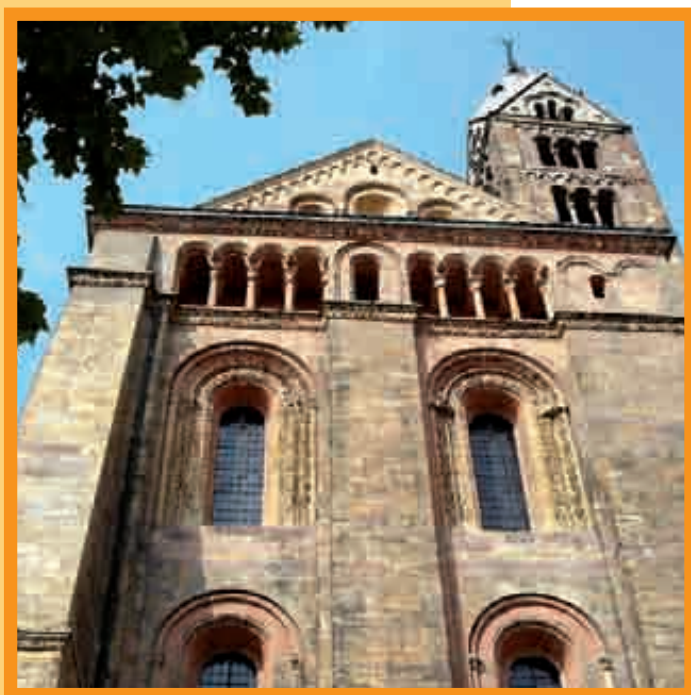
LA TOUR NÉO-GOTHIQUE DE L'ÉGLISE PAROISSIALE SAINTE-MARIE DOMINE LA JULIUSPLATZ, UN DES PLUS JOLI COIN DE NEUSTADT.