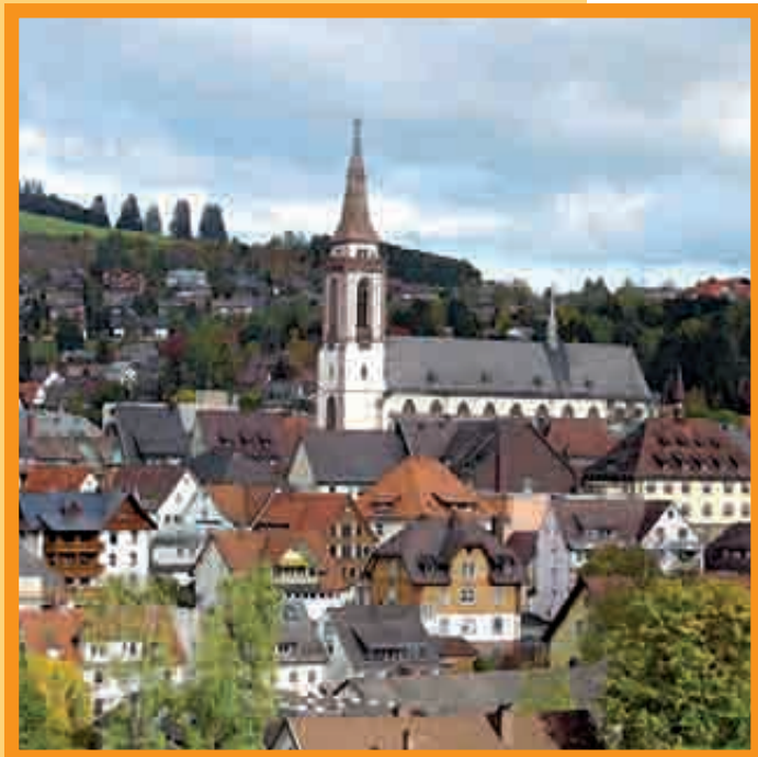
VENEZ DÉCOUVRIR LA CAPITALE SECRÈTE DU VIN : NEUSTADT!