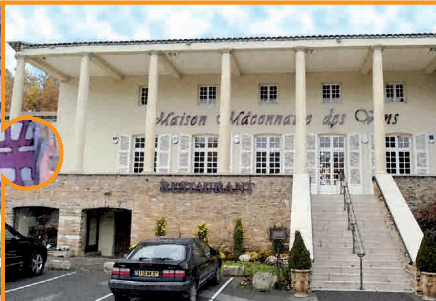
... NOTRE MAISON DES VINS PROPOSE ELLE AUSSI LA DÉGUSTATION DES VINS LOCAUX ET UNE RESTAURATION TRADITIONNELLE.