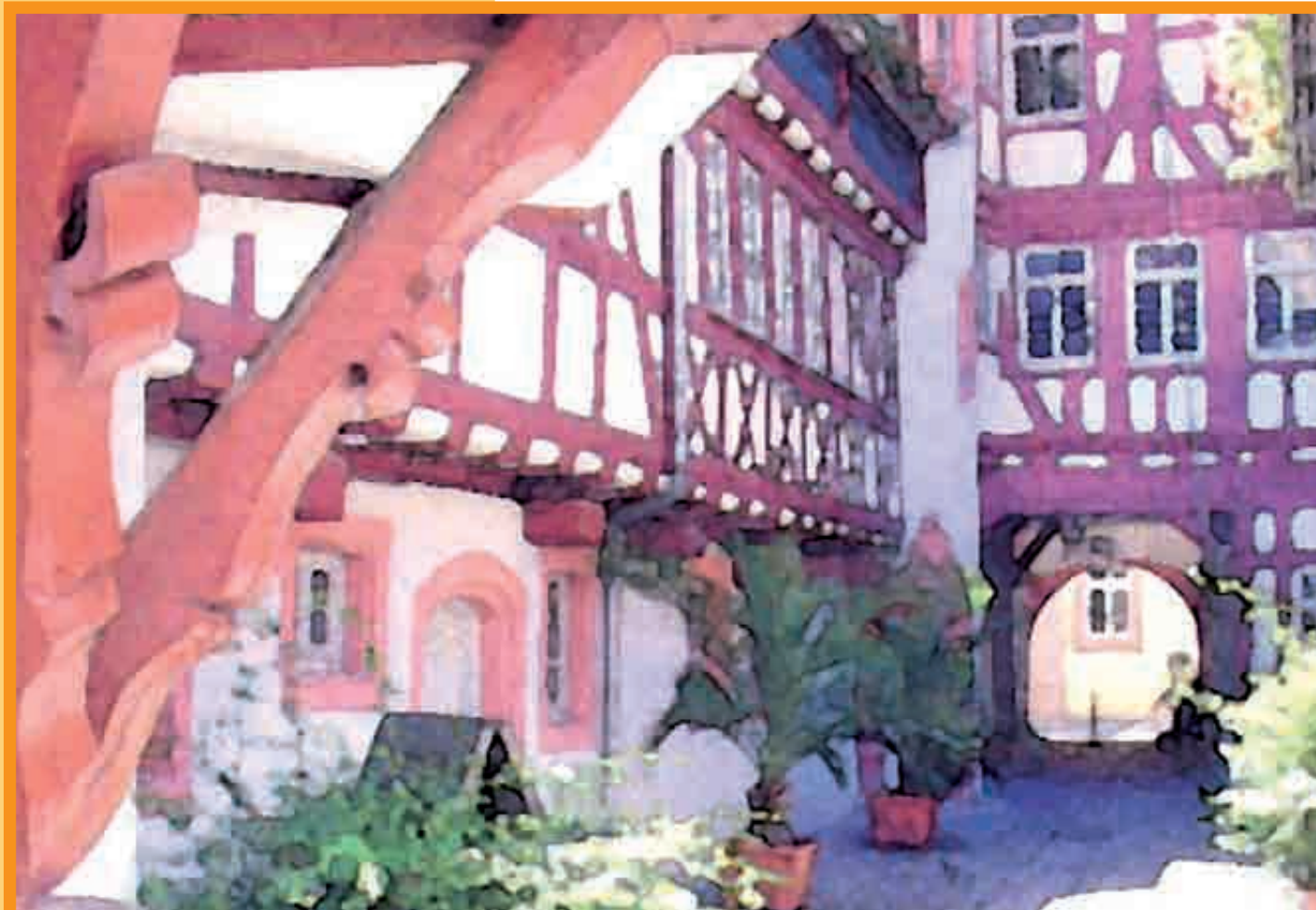
C'EST DANS CETTE MAISON DATANT DE 1276 QUE LES VITICULTEURS DE NEUSTADT PRÉSENTENT LEURS VINS...

Le château de Hambach est considéré comme le berceau de la démocratie allemande puisqu'en 1832 de nombreux manifestants se sont rassemblés pour demander pour la première fois la création d'une Allemagne unie et démocratique en arborant le drapeau noir, rouge et or.